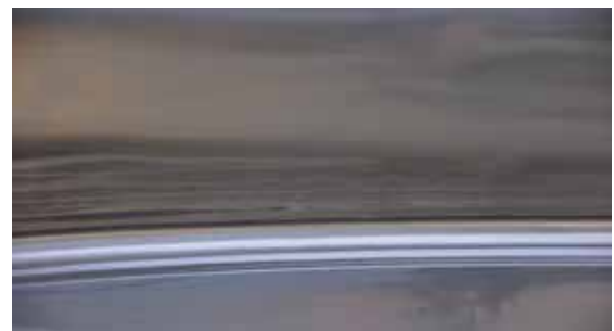
Saldatura, Tig/Plasma circolare interna del bordo del fondo, rullata e lucidata a specchio