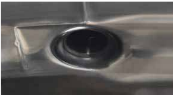
Saldatura interna di un manicotto din, rasata e lucidato a specchio