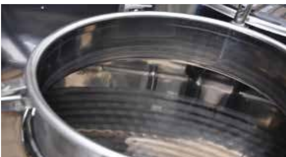
Saldatura interna, rasata e lucidata, del collo del chiusino