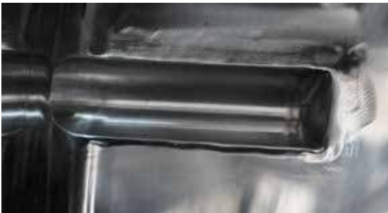
Saldatura interna lucida di scarico totale, a bocca di flauto