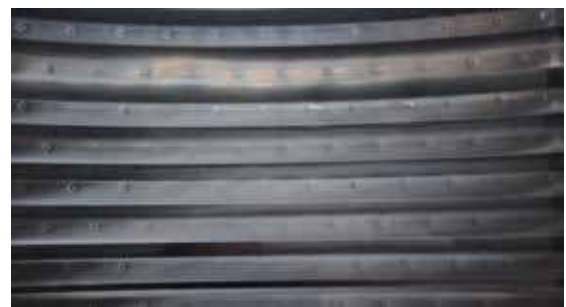
Interno lucido di intercapedine "Termostar", nella zona della trapuntatura, viene rilucidata la lamiera