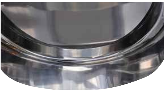
Saldatura interna, rasata e lucidata, di una portella tonda